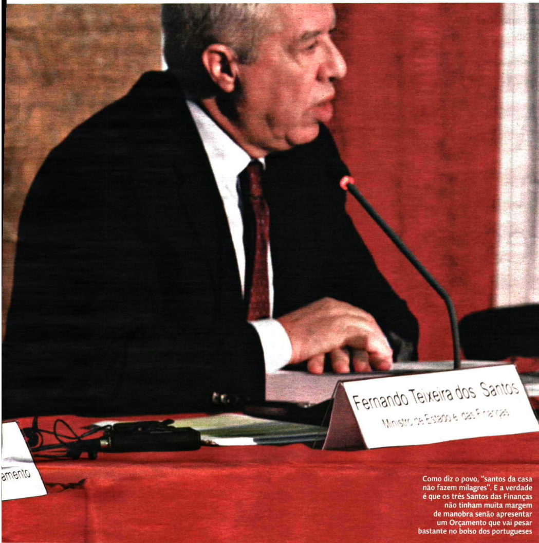
Como diz o povo, "santos da casa não fazem milagres". E a verdade é que os três Santos das Finanças não tinham muita margem de manobra senão apresentar um Orçamento que vai pesar bastante no bolso dos portugueses