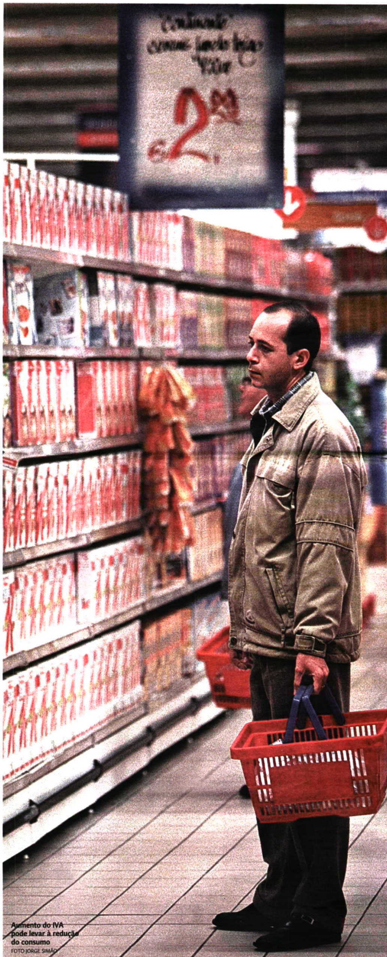
Aumento do IVA pode levar à redução do consumo